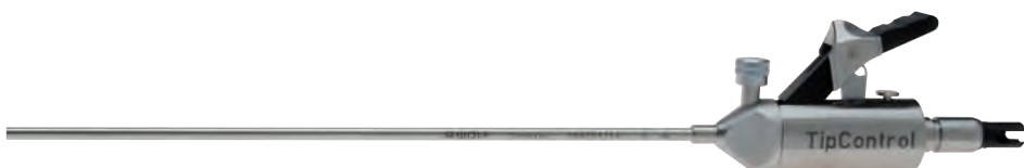
TipControl® – шарнирный костный бур, в сборе