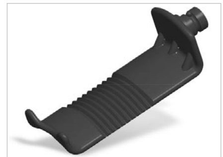
ulrich Caspar Valven stumpf ulrich Caspar blades blunt