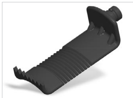
ulrich Caspar Valven lateral ulrich Caspar blades lateral